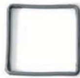
Priprema dihtunga na licu mesta