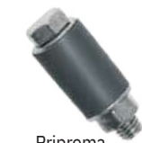
Priprema odstojnika za umetke na licu mesta