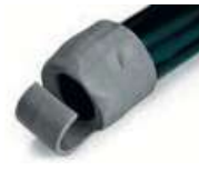
Priprema deflektora, mlaznica, devijatora protoka