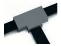
Izolacija spojeva na bakarnim sabitricama i transformatorima