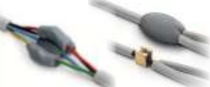
Izolacija višestrukih priključaka