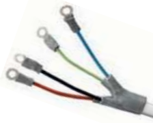
Izolaciju NN terminala i papučica