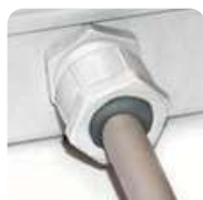
Zaptivanje kablovskih vodnica