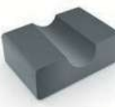
Priprema kalupa i podupirača na licu mesta