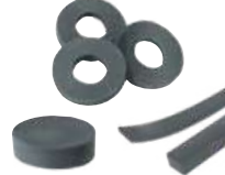
Priprema šipki, podloški, izolatora okrugle žice